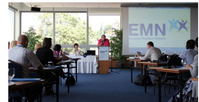
Vzdelávací seminár EMN Migrácia globálne a lokálne

EMN alebo so zástupcami srbského Komisarátu pre utečencov), stretnutí s vysokoškolskými študentmi, pracovných raňajok (napr. s novinármi, zástupcami štátnej správy či akademickej obce), expertných seminárov (napr. so zástupcami vybraných subjektov pôsobiach v azylovej problematike alebo so zástupcami hraničnej a cudzineckej polície) a konzultácií k akademickým prácam.